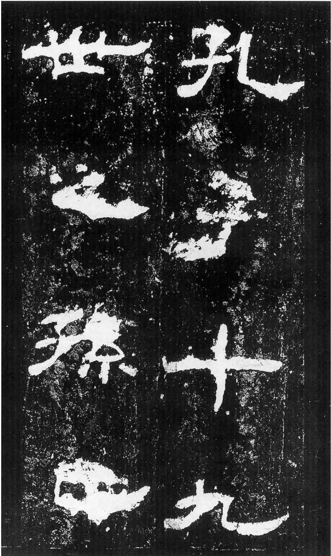
孔子十九世之孫也