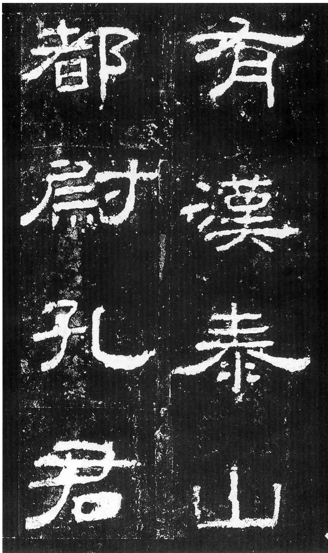
有漢泰山都尉孔君