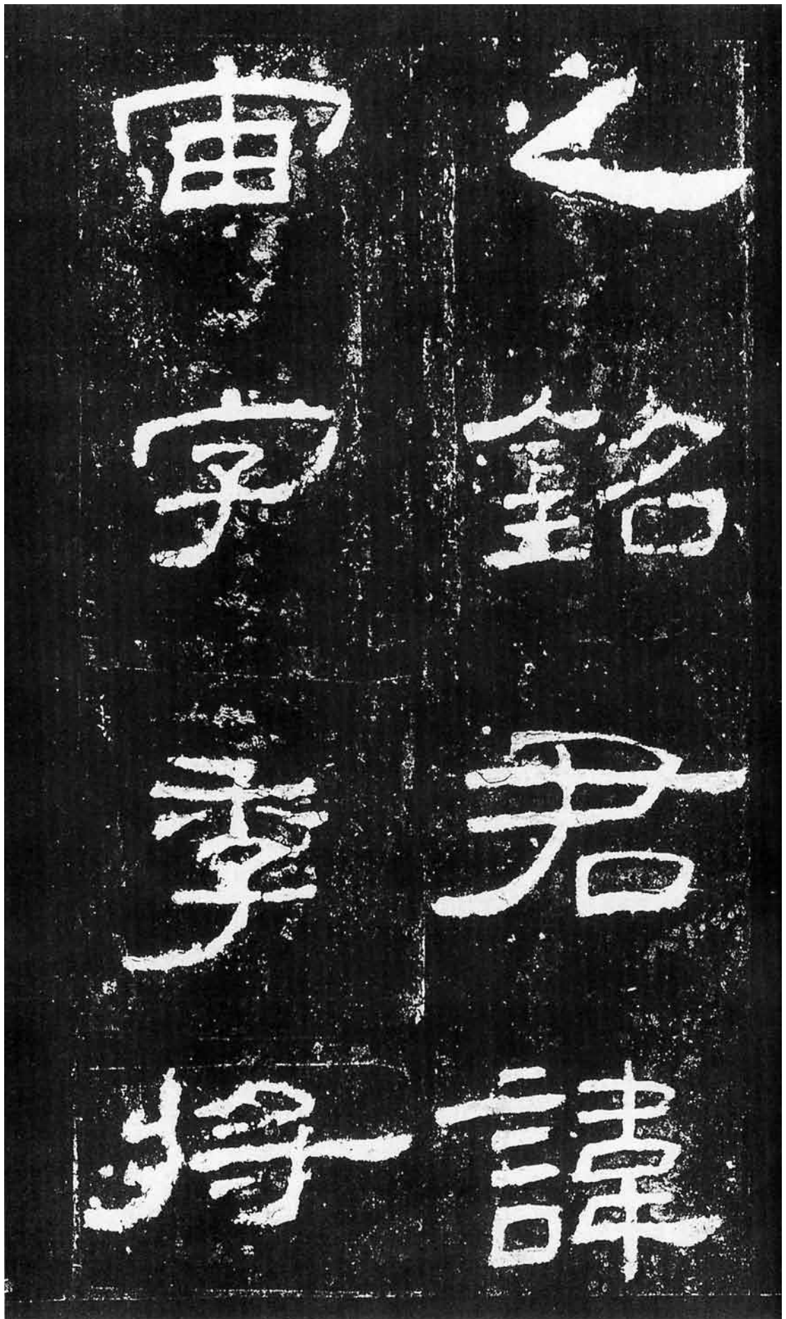
之銘君諱宙字季將