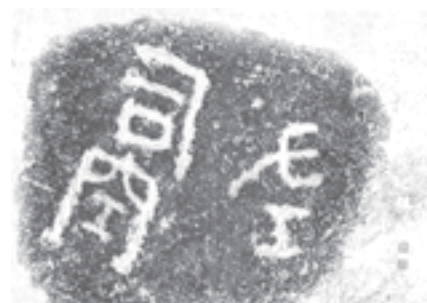
霍去病墓石刻題記